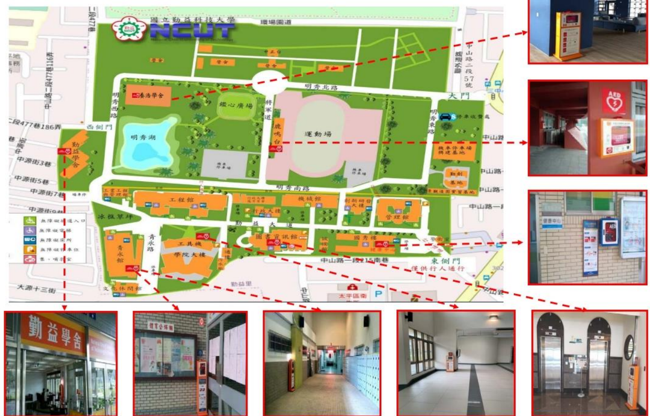
國立勤益科技大學 自動體外心臟去顫電擊器(AED)設置位置圖