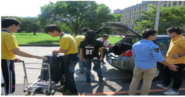
6. 辦理完入住手續後，再至停車區拿取行李。