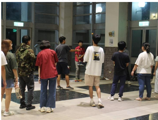
關卡 5 進行