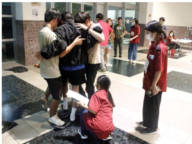
關卡 4 進行