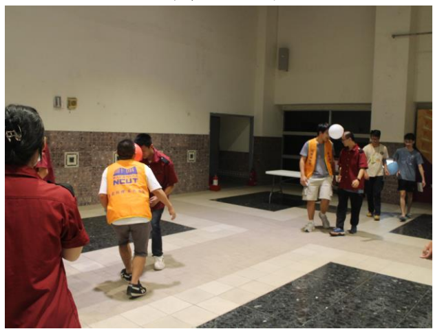
關卡 1 進行