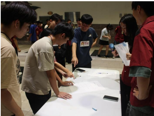
關卡 2 進行